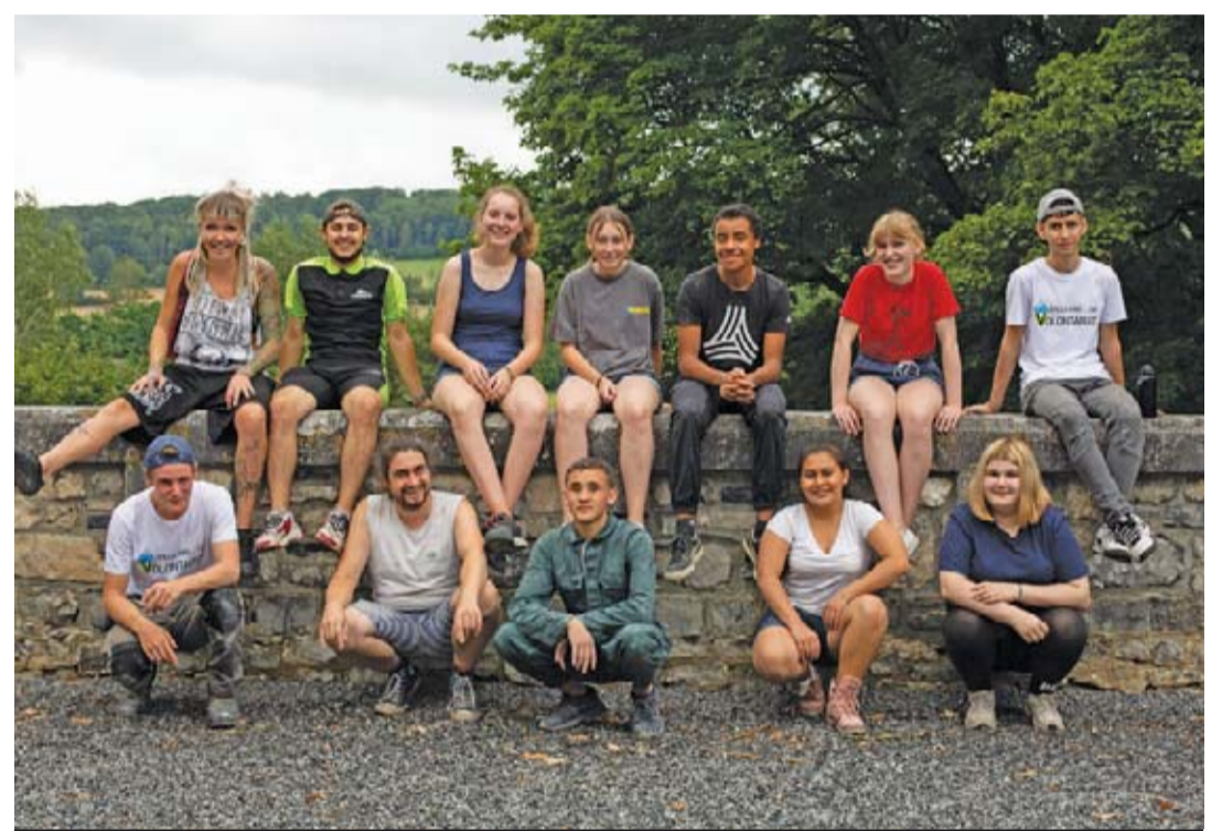
Première expérience de volontariat pour la plupart de ces jeunes âgés de 15 à 17 ans.

Les Compagnons Bâisseurs devaient construire des cabanes au Domaine de Chevetogne du 8 au 22 août. Le chantier a malheureusement dû être annulé en raison du Covid-19. « Les règles se sont durcies et les organisateurs ne se sont pas sentis capables d'accueillir un groupe qui dort sur place. Il n'était pas possible d'assurer les bulles de contact dans ces conditions », déplore-t-on chez Les Compagnons Bâisseurs.