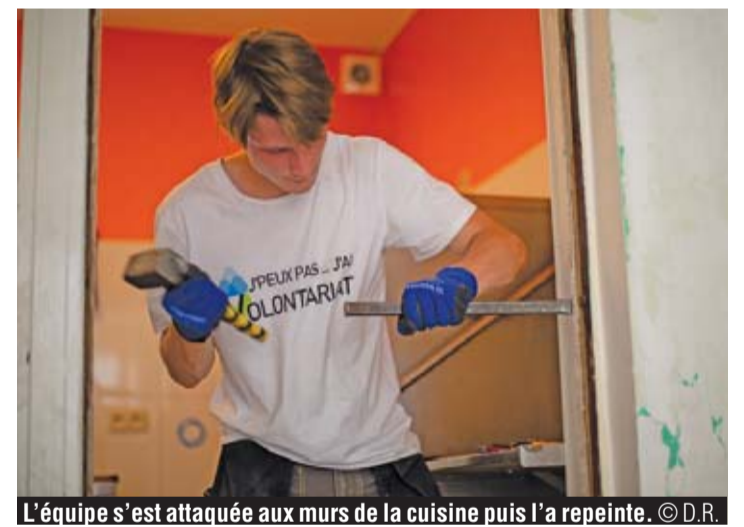
L'équipe s'est attaquée aux murs de la cuisine puis l'a repeinte.